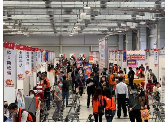
【創新創業】3月13日「台北人力銀行第1季博覽會」