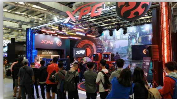
108 年 11 月 21 日「2019 WirForce」