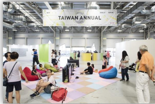
108年8月31日「2019 臺灣當代一年展」