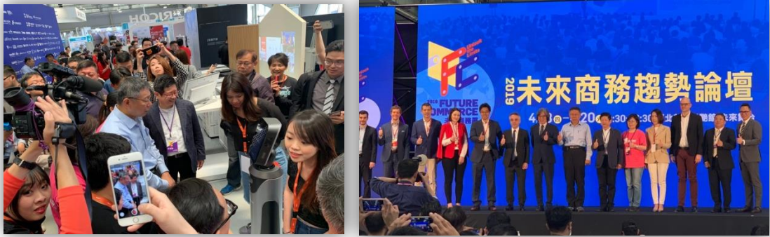
108年4月18日「2019 Future Commerce 未來商務展」