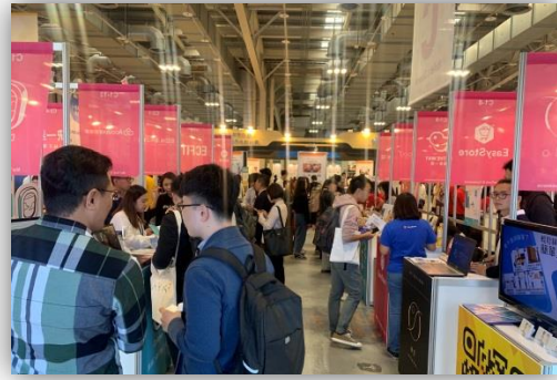
108 年 11 月 14 日「2019 Meet Taipei 創新創業嘉年華」