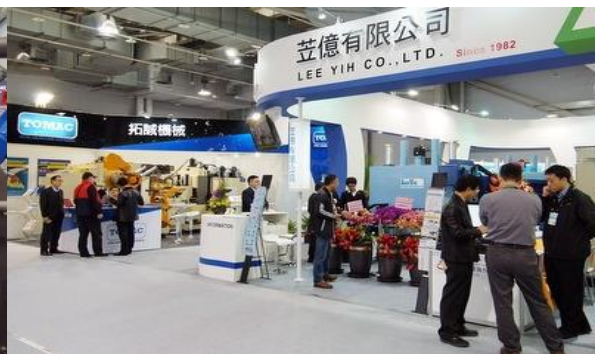
「國際性」：3月7日至3月12日，2017年臺北國際工具機展 (TIMTOS 2017)