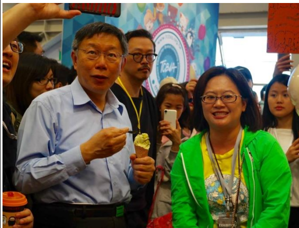
右圖，11月23日至11月26日，Wir Force 2017