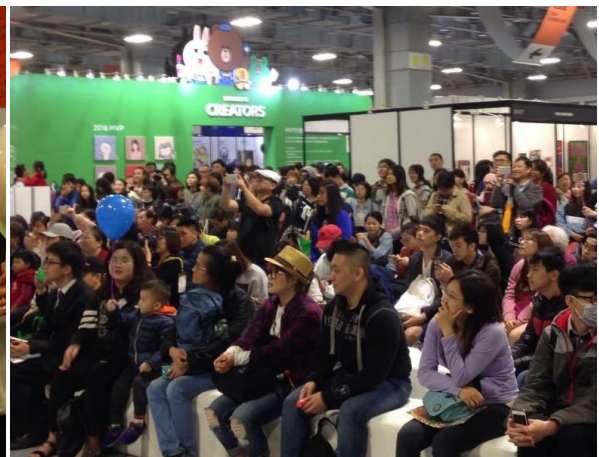
「文化創意」：4月19日至4月23日，2017 臺灣國際文化創意產業博覽會