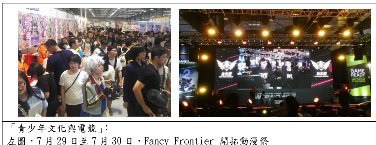
「青少年文化與電競」：