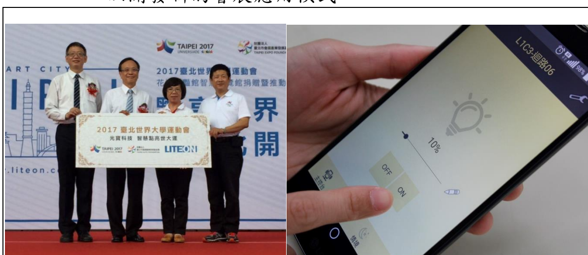
106 年 8 月 17 日：光寶科技捐贈花博公園爭艷館節能燈具啟用儀式

未來，將進一步推展智慧化應用，包括燈光調控、人流管制，透過大數據分析提供策展廠商商運分析，以開發新的會展應用模式。