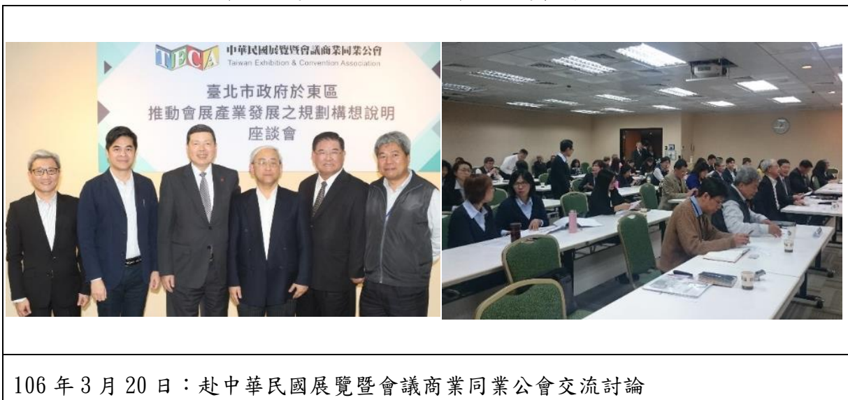
106 年 3 月 20 日：赴中華民國展覽暨會議商業同業公會交流討論

「臺北市南港轉運站東側商業區土地公辦都市更新案」則於 107 年 1 月 5 日正式公告招商，預計 115 年完成興建，116 年完成裝潢啟用。