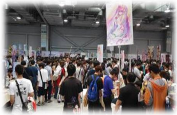
◎「Petit Fancy 亞洲動漫創作展」會展實景。