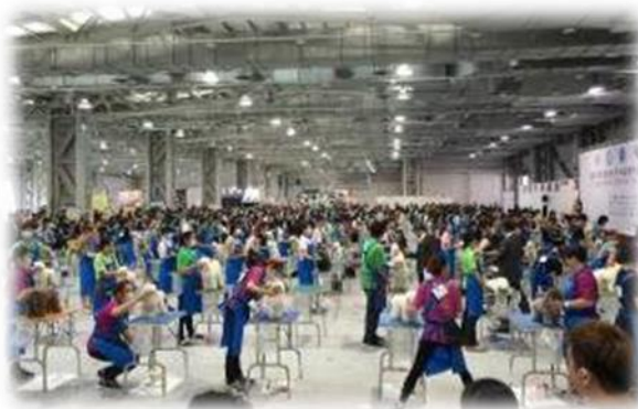
◎「2015 年世界畜犬聯盟-亞太區國際畜犬展覽比賽」會展實景。