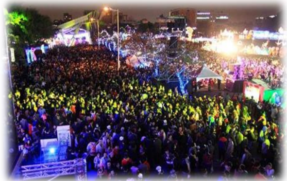
◎花博園區舉辦之「2015 臺北燈節」廣受市民好評。