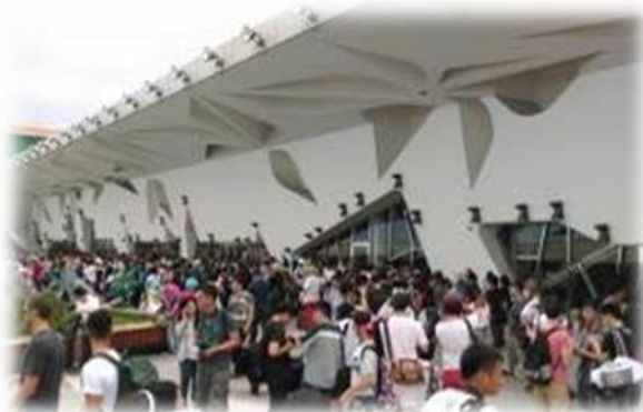
◎「In Comic Energy ICE 動漫之力 II」會展實景。