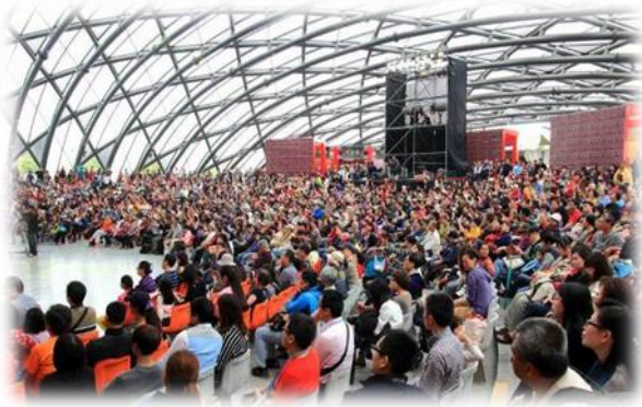
◎「北京文化廟會•臺北之旅」邀請北京「非物質文化遺產」大師及作品來臺北。