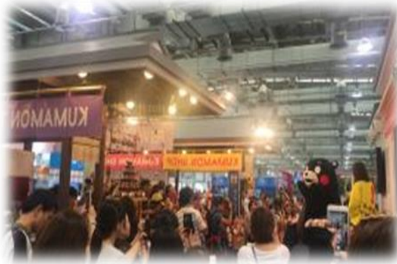
◎「2015 新•日本旅遊節」會展實景。